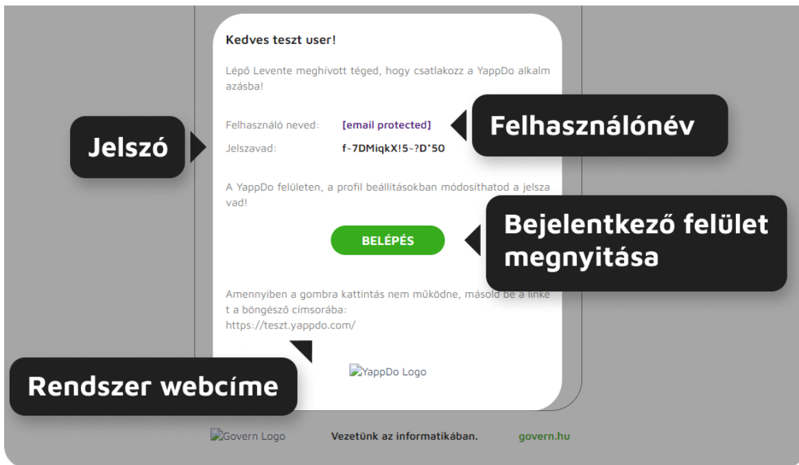
3. ábra -