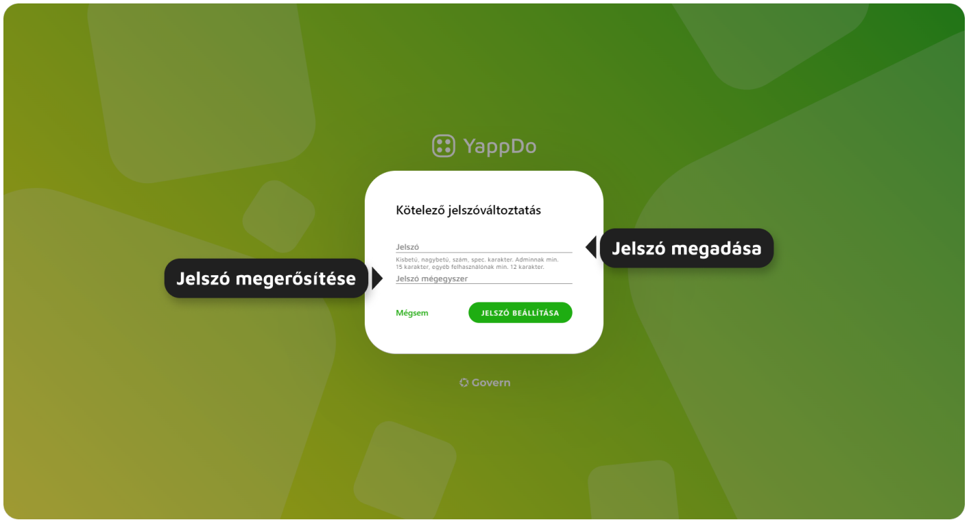
4. ábra - Kötelező jelszóváltoztatás felület