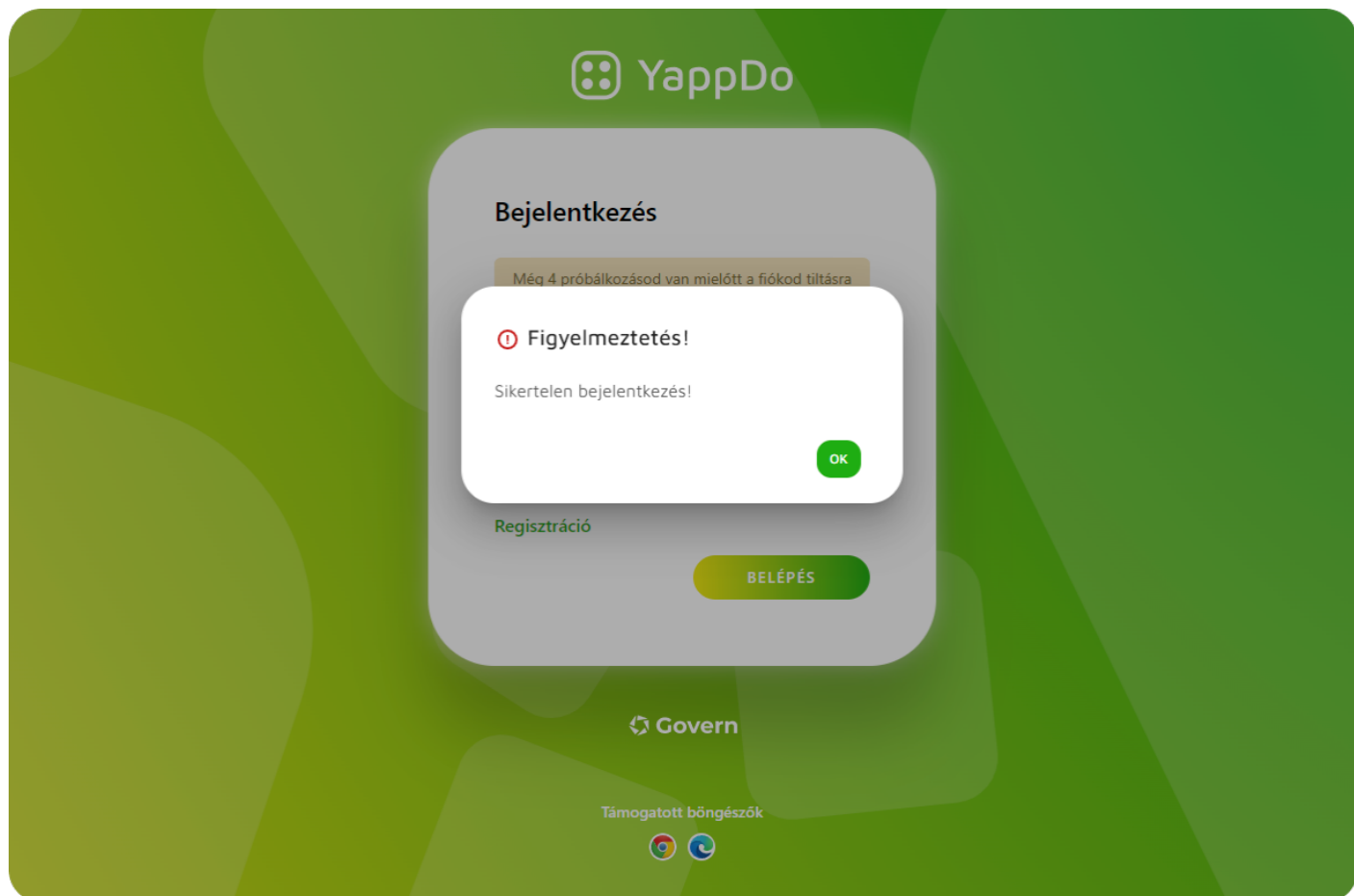
1. ábra - Sikertelen bejelentkezés

Egymást követő 5 darab sikertelen bejelentkezési kísérletet követően a rendszer zárolja a felhasználói fiókot.