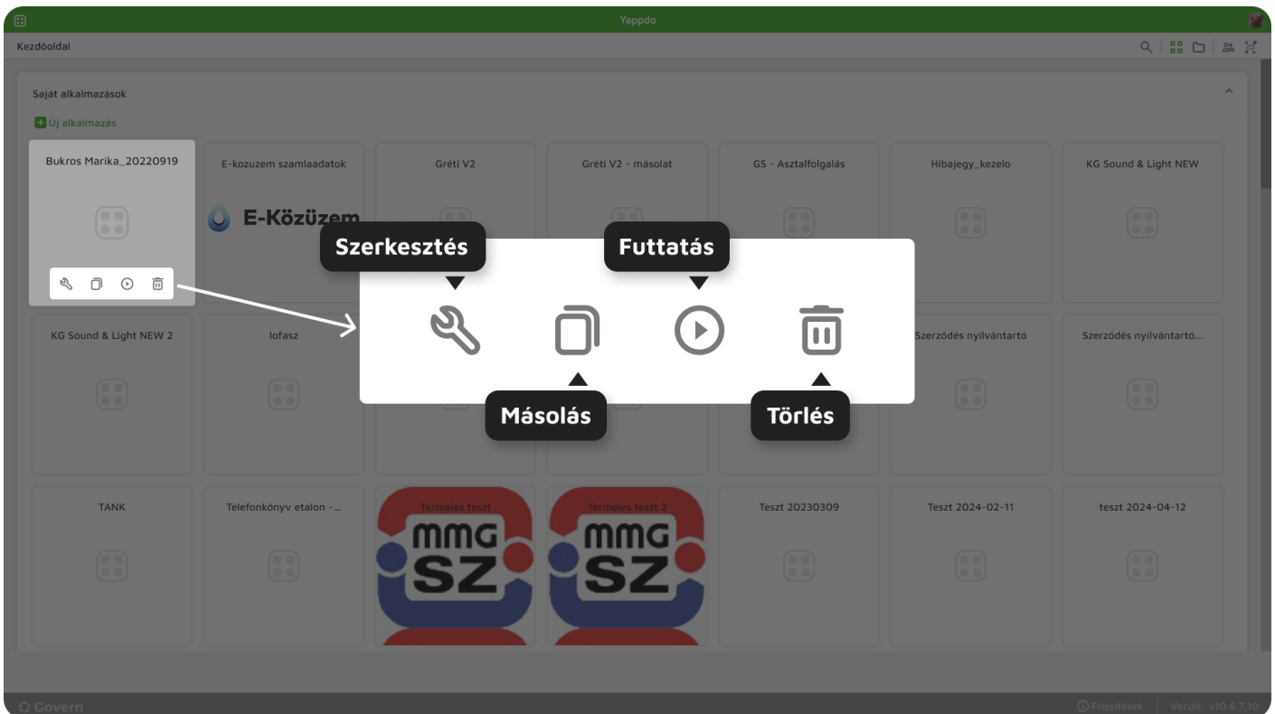
1. ábra - Alkalmazás műveletek